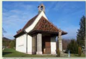
Chapelle Notre Dame à Rammersmatt