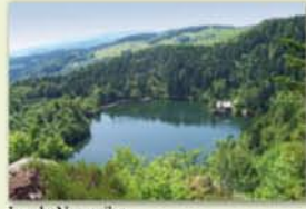
Lac du Neuweiher