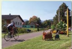
Piste cyclable à Wegscheid