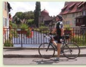
La Thur et la Tour des sorcières à Thann