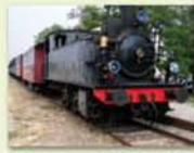
Train Touristique de la Doller