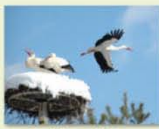
Parc à cigognes de Cernay