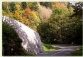
Route du col du Bramont