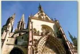
Collégiale St Thiébaud XIV e - XV e à Thann