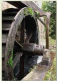
Moulin à huile de Storckensohn