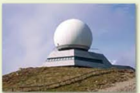
Sommet du Grand-Ballon