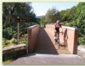
Traversée de la Doller à Sentheim

Cinq kilomètres, dix ou plus, en famille ou entre amis, choisissez votre programme ! Au départ de l'Ecomusée d'Ungersheim, remontez la Thur par Cernay, passez au pied du vignoble du Rangon, pénétrez au cœur de la vieille ville de Thann. En surplomb de Saint-Amarin, admirez le défilé de la Haute Vallée de la Thur. L'itinéraire cyclable vous mène jusqu'au lac de Kruth-Wildenstein et vous propose un retour par la rive opposée via le Sée d'Urbès.