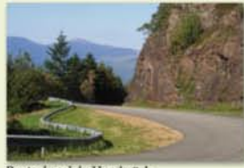
Route du col du Hundsrück